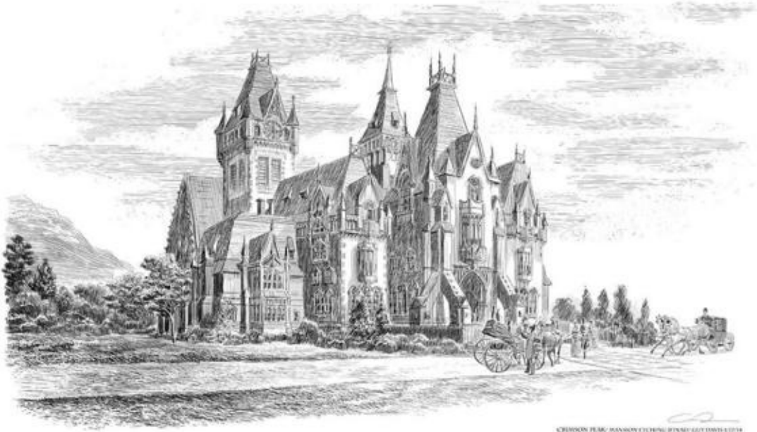
CHURCH OF PEAC - MANSON CHURCH BY DANIEL DOWLING